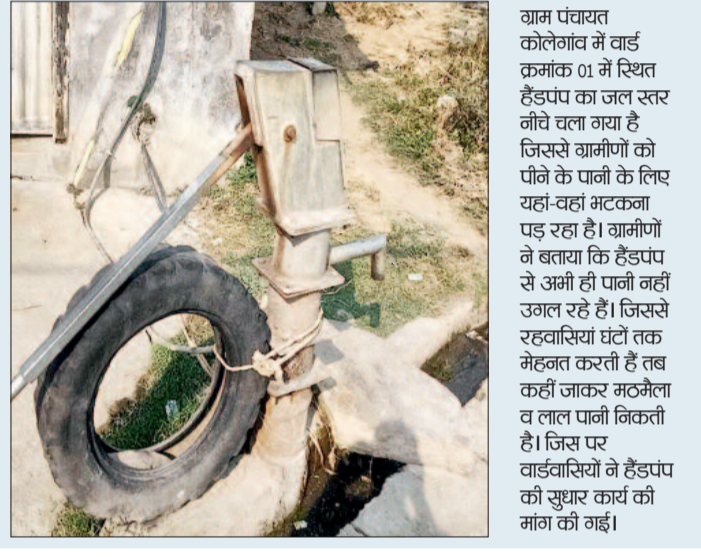
ग्राम पंचायत कोलेगांव में वार्ड क्रमांक 01 में स्थित हैडपंप का जल स्तर नीचे चला गया है जिससे ग्रामीणों को पीने के पानी के लिए यहां-वहां भटकना पड़ रहा है। ग्रामीणों ने बताया कि हैडपंप से अभी भी पानी नहीं उगल रहे हैं। जिससे रहवासियों घंटों तक महिमत करती हैं तब कहीं जाकर मठमैला व लाल पानी निकलती है। जिस पर वार्डवासियों ने हैडपंप की सुधार कार्य की मांग की गई।