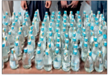
हरिभूमि न्यूज ►► राजनांदगांव

शांतिपूर्ण हुई परीक्षा : पहले दिन कक्षा 12वीं की बोर्ड परीक्षा जिले में शांतिपूर्ण संपन्न हुई। बोर्ड परीक्षा का आयोजन सुबह 9 बजे से दोपहर 12.15 बजे तक आयोजित किया गया। परीक्षा देकर निकले कक्षा 12वीं के परीक्षार्थियों ने कहा कि उन्होंने बोर्ड परीक्षा को लेकर पहले ही अपनी अच्छी तैयारी की हुई थी। उन्होंने कहा कि लगभग सभी सवालियों को हल करने कोशिश की गई, समय कम होने के कारण एक दो सवाल छूट गए।