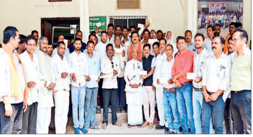
ग्राम रेवेली, सदगुरु कबीर कुटी पनिका समाज कवर्धा, सदगुरु कबीर कुटी सेवा समिति ग्राम