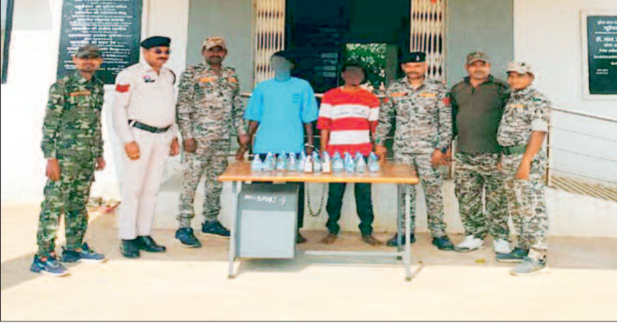
मुखबिर की सूचना पर सिधनपुरी पुलिस ने की कार्यवाही

61 पौवा अवैध शराब के साथ दो आरोपी गिरफ्तार